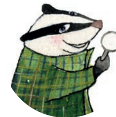
Mäyrän kuvitus: Ulla Phillips Taitto: Kaisu Saastamoinen