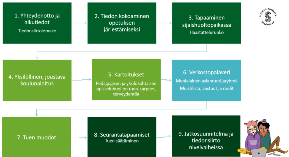
Kuvio 2. Sisukas-toiminnan vaiheet (Pesäpuu.fi).

vertailukelpoisilla testeillä. Kartoitusten toteuttamisen jälkeen lapsen verkosto keskustelee alkukartoituksen tuloksista ja laatii oppimissuunnitelman, johon kirjataan tuen tavoitteet, vastuut ja aikataulut. Seuraavan kahden vuoden aikana lapsi ja verkosto kokoontuvat säännöllisin välein päivittämään oppimissuunnitelmaa ja tehdään seurantakartoitukset tuen vaikuttavuuden selvittämiseksi. Seuranta jatkuu peruskoulun loppuun saakka. Nivelvaiheissa laaditaan jatkosuunnitelma ja välitetään tarvittavat tiedot eteenpäin. (Liukkonen ym., 2015, s. 14–15, 29; Pesäpuu.fi)