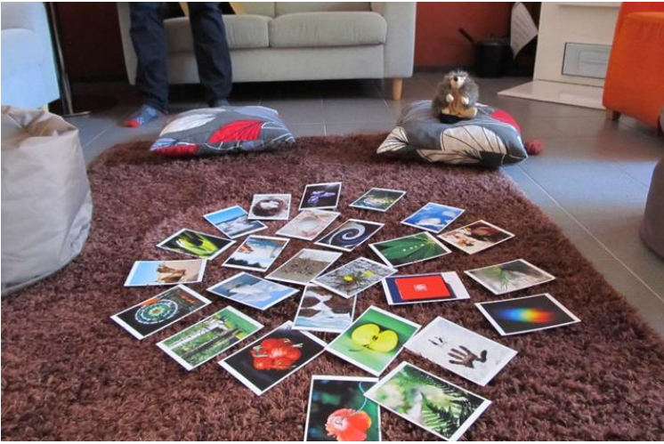
Kuva 1. Siili salapoliisi ja fiiliskortit