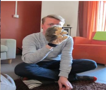
Kuva 3 Siilisalapoliisi ja ohjaaja