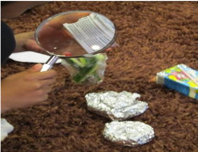
Kuva 5 Salapoliisit eväitä tutkimassa