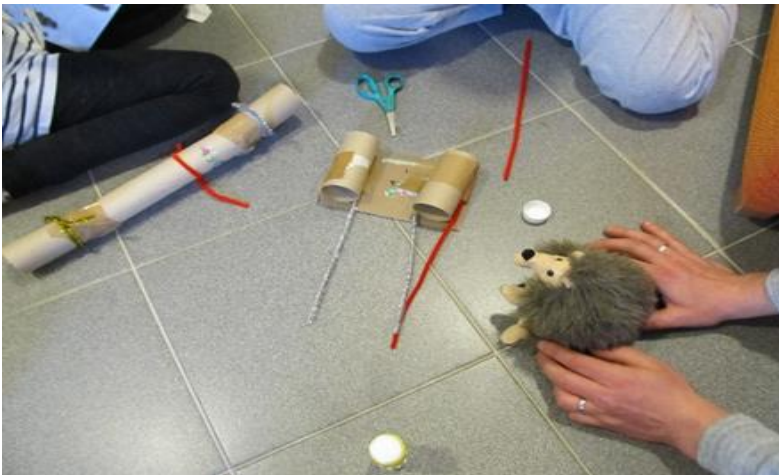
Kuva 6 SiiliSalapoliisi ihmettelemässä auttamiskoneita.