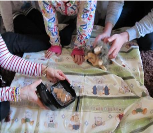
Kuva 2 Salapoliisit eväitä tutkimassa