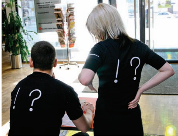
Selviytyjät Lastensuojelun asiantuntijat